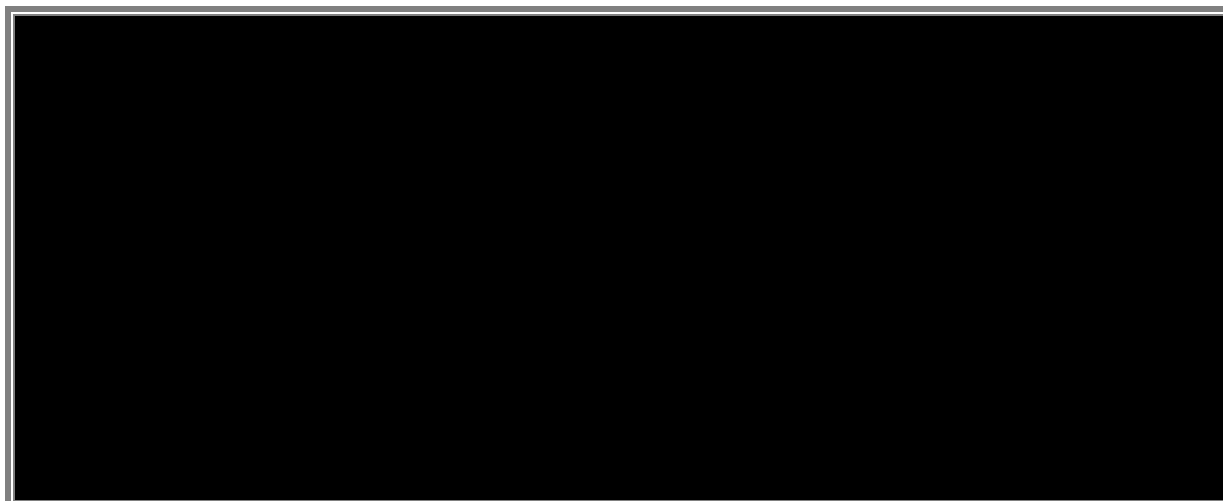
Tableau 7.5 b : Répartition de la population résidente de 3 ans et plus selon le niveau d’instruction atteint par milieu de résidence et le sexe (zone urbaine).