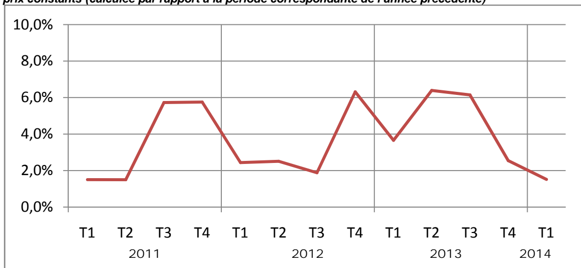
Graphique n°4 : Évolution du taux de croissance de la valeur ajoutée trimestrielle brute du secteur tertiaire à prix constants (calculée par rapport à la période correspondante de l'année précédente)

L'évolution à la hausse du secteur tertiaire a été sensiblement amoindrie par la baisse de la valeur ajoutée du commerce (-1,5%) et du transport (-7,4%). Le repli dans le secteur du commerce est en liaison avec la baisse des importations de biens.