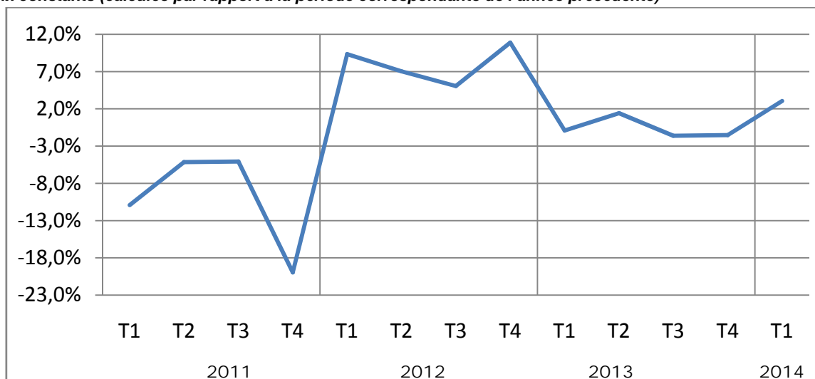
Graphique n°2 : Évolution du taux de croissance de la valeur ajoutée trimestrielle brute du secteur primaire à prix constants (calculée par rapport à la période correspondante de l'année précédente)

Au premier trimestre de 2014, la valeur ajoutée du secteur primaire a progressé de 3,1% par rapport à la période correspondante de 2013. L'activité économique s'est relancée après avoir atteint -1,6% au trimestre précédent. L'accélération de l'activité dans ce secteur résulte notamment du dynamisme des sous-secteurs de l'agriculture (+7,5%) et de l'élevage (+4,1%). Ces bons résultats sont portés par la bonne tendance actuelle des cultures horticoles. Toutefois, les performances du secteur ont été atténuées par la baisse de la valeur ajoutée de la pêche (-3,6%) et des industries extractives (-12,3%) en relation avec les baisses, par rapport au trimestre correspondant de 2013, des débarquements des produits halieutiques et des productions de phosphates et d'or. Cette dernière évolution est étayée par une baisse sensible des exportations d'or, en glissement annuel, de l'ordre de 34,8% en valeur et de 19,7% en volume.