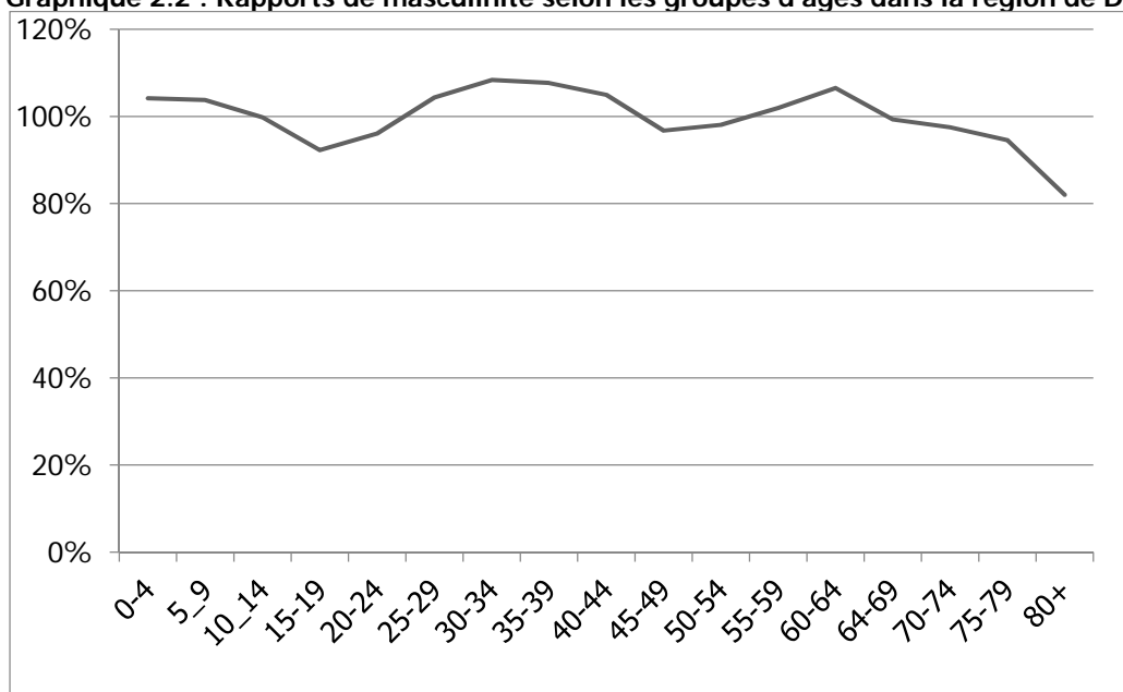
Graphique 2.2 : Rapports de masculinité selon les groupes d'âges dans la région de Dakar en 2014

Source : Projections de la population de la région de Dakar - 2013-2015