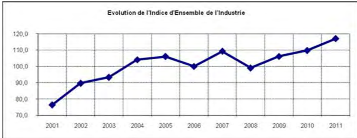
Graphique 16.1 : Evolution de l'Indice d'Ensemble de l'Industrie