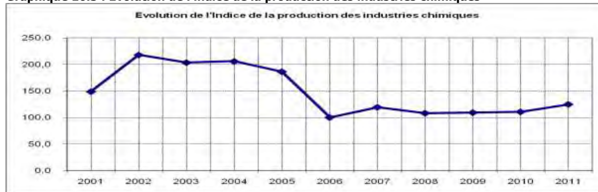
Graphique 16.3 : Evolution de l'indice de la production des industries chimiques

Les prix à la production quant à eux, se sont accrus de 16,4% en 2011. Cette situation est imputable à un renchérissement de la production chimique de base (+20,4%) lié à une hausse des prix de l'acide phosphorique. Au même moment, les produits pétroliers raffinés ont vu leurs prix à la production augmenter du fait de l'accroissement des cours du baril. La progression des prix de l'acide phosphorique est consécutive à une révision de la structure des prix. Toutefois, la dépréciation des prix des autres produits chimiques de base (-10,6%) et, dans une moindre mesure, des produits en matières plastiques a réduit l'ampleur de la hausse des prix de la branche.